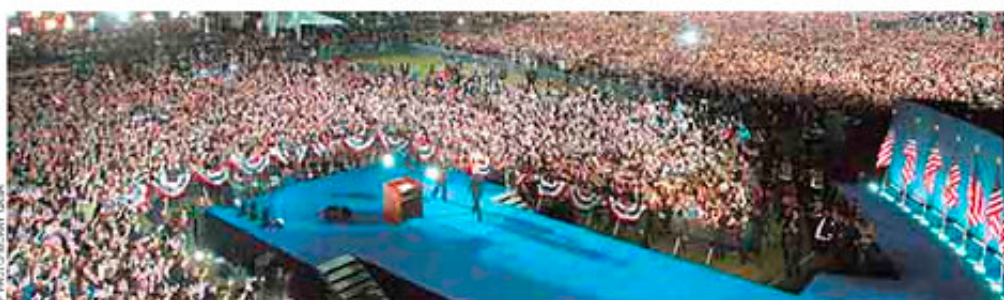
Δύο φερόμενοι κορτάζοι τον νίκη στο κέντρο του ακαούστου Γκραντ Πάρκ στο Σικάγο: ο θριαμβευτής Μπαράκ Ομπάμα και ο αντιπρόεδρος του Τζο Μπάιντεν